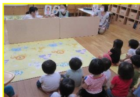
ペープサート劇場

全体でパーティーはできないですが、また、こうしてお部屋で機会を作って、みんなで楽しんでいきたいと思います。