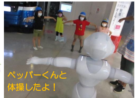
ペッパーくんと体操したよ！