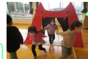
ももたろうの 鬼だぞ やいやい!