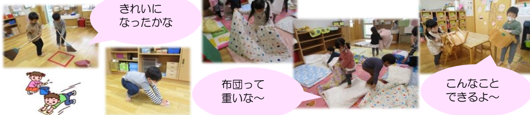
きれいに なったかな

“お手伝いは自分の仕事”、と子どもたちなりに責任感を持つことで、自分でしようという気持ちで育ちます。子どもたちの成長につながる『お当番活動』をこれからも大切にしたいと思っています。