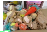
劇で作った野菜は おままごとで使っています

先月は生活発表会がありました。当日はビデオ撮影があり、緊張している子やいつも通りの姿を見せてくれる子など様々でしたが、子どもたち一人一人が楽しく表現できたと思います。終わってからも子どもたちの発表会の熱は冷めません。ステージの上に登って朝の体操をしたり、他クラスの踊りや歌を歌ったりする姿が見られました。きく組では、役を変えて劇遊びをしました。子どもたちは自分の役ではないのに、セリフや動きを最後まで演じきっていて、他の友だちのこともしっかり見ていたんだと驚かされました。これからも、劇で取り組んだ遊びをさらに広げていけるようにしていきたいと思います。