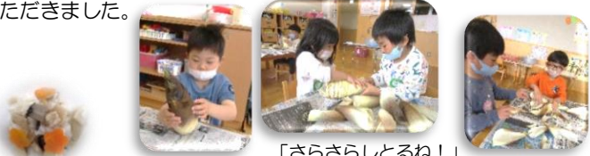
「さらさらしとるね!」「ぬれとる!」「なんかせんあるー!」たけのこの皮何枚あるかな?

4月18日(月)にひまわり組、4月27日(水)にきく組の子ども達がたけのこの皮むきをしました。皮つきのたけのこを見ると「でっか!」「なんかぬれとる!」「ふわふわしてる~」などの声が聞こえてきました。そこで栄養士から、たけのこの話を聞き、たけのこの中はどうなっているか①「種になっている」②「迷路になっている」③「お部屋になっている」の3択クイズが出ました。まずはたけのこの皮をむきました。子ども達はよく観察しながらむき「ふわふわからつるつるになったー」「なんかにおいする」など感じたことを話しながら一枚一枚楽しみながらむきました。むき終わった後は実際に目の前で切ってもらいクイズの正解を見て大盛り上がりでした。子ども達がむいたたけのこは「たけのこごはん」や「たけのこの含め煮」としてみんなでおいしくいただきました。