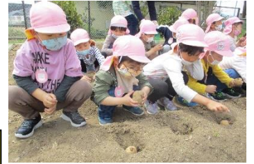
自分で植えたジャガイモに看板を立てたよ

じゃがいもを植えて 1 か月半ほど経ちます。じゃがいもカレンダーを見て「今日は 38 日目やよ」「じゃがいもカレンダー忘れとるよ」と誰かが必ず覚えていてくれてみんながじゃがいもの生長を楽しみにできるきっかけをくれる子ども達です。じゃがいもカレンダーも「何日でじゃがいもできるのかな?」と疑問に思った声から始まりました。