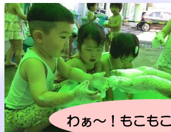
わあ～！もこもこ☆フワフワ☆