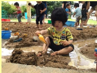
どっかり座って 泥んこに夢中だよ！