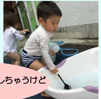
体に水がかかるとビックリしちゃうけど おたまで遊ぶと楽しいな～