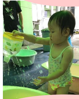
カップやペットボトルで遊ぶよ シャワーみたい☆