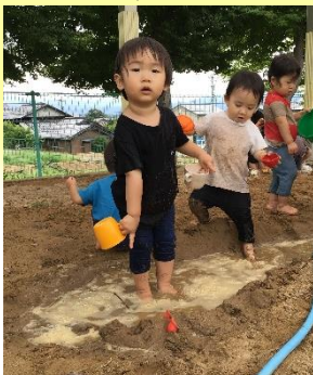
見て！足が見えなくなったよ