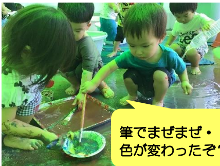
筆でまぜまぜ・・・ 色が変わったぞ？！