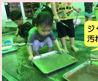
ジャブジャブ・・・ 汚れたお盆あらいま～す