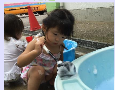
真剣に泡をすくっています！