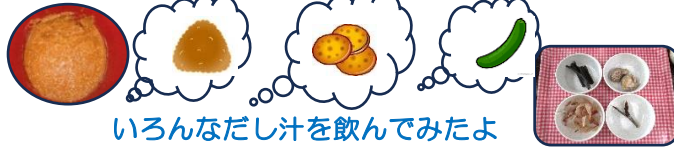
いろいろなだし汁を飲んでみたよ

★昨年度さく組(現ひまわり組)さんが味噌作りに挑戦しました。そして待つこと約半年、ついに完成です!とってもきれいな色のたくさんの味噌ができて、子ども達は出来上がった味噌に興味津々です。何に入れるかみんなで考え中です。