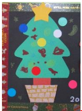
なぐり描きとシール貼りでツリー

クリスマスの制作をしました。クレヨンでなぐり描きをした後、シールを貼ってクリスマスツリーを作ったり、お顔の写真をつけてトナカイを作りました。