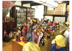
中海でお人形も見せてもらったよ！