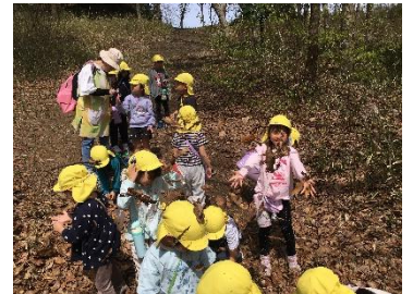
月津こども園の周りを探検し、月津の魅力やみんなが知らなかった月津を発見！