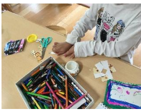
シールをいかしてこのほり制作もしました！

きく組から引き続きラキュー制作やシール帳のブームが続いているひまわり組の子ども達ですが、だんだんとシール作り・ラキューともに進化していて、シールでは描いた絵の他に広告を切ってコラージュ（素材を組み合わせたもの）したものもあり、面白いシール帳が出来上がってきています。ラキューでも平面の作品が多かったのですが、本を参考にしながら立体的な作品が増えてきています。今後どんな風に発展していくのかとっても楽しみです。